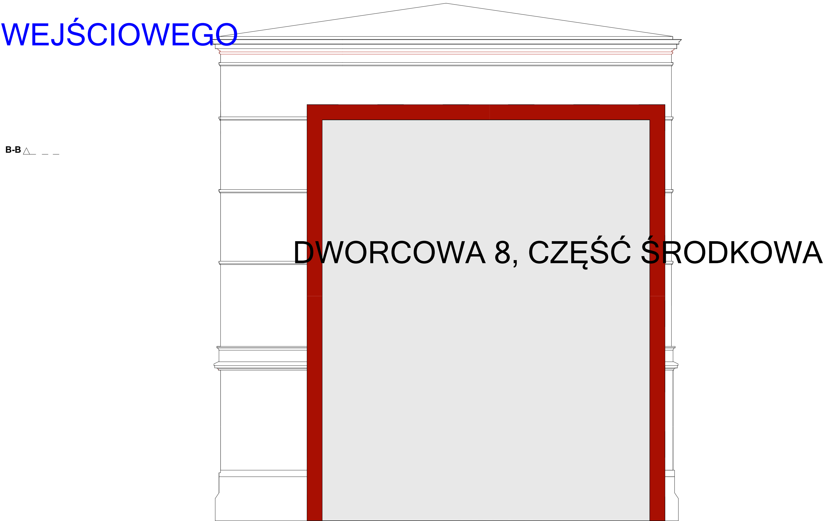
DWORCOWA 8, ELEWACJA BOCZNA OD STRONY DW6, DZIEDZINCA WEJŚCIOWEGO